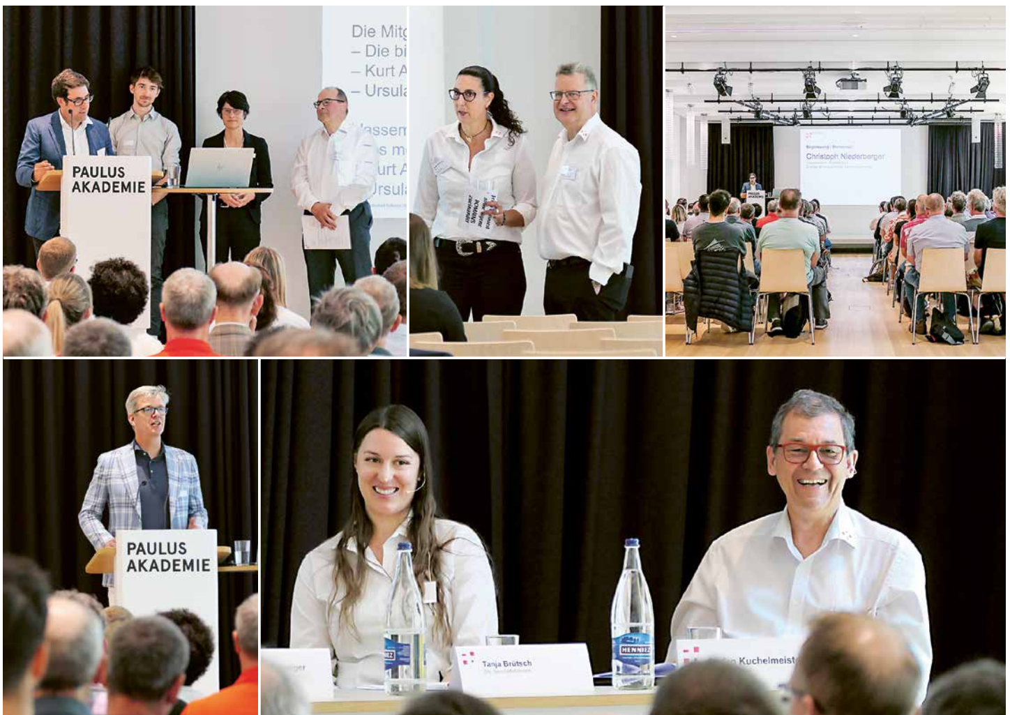
L'assemblée générale a eu lieu le 1 er juin 2023 dans les locaux de la Paulus Akademie à Zurich.

professionnelle. La plupart des femmes enceintes souhaitent exercer leur profession le plus longtemps possible avant l'accouchement et beaucoup de mères souhaitent la poursuivre par la suite.